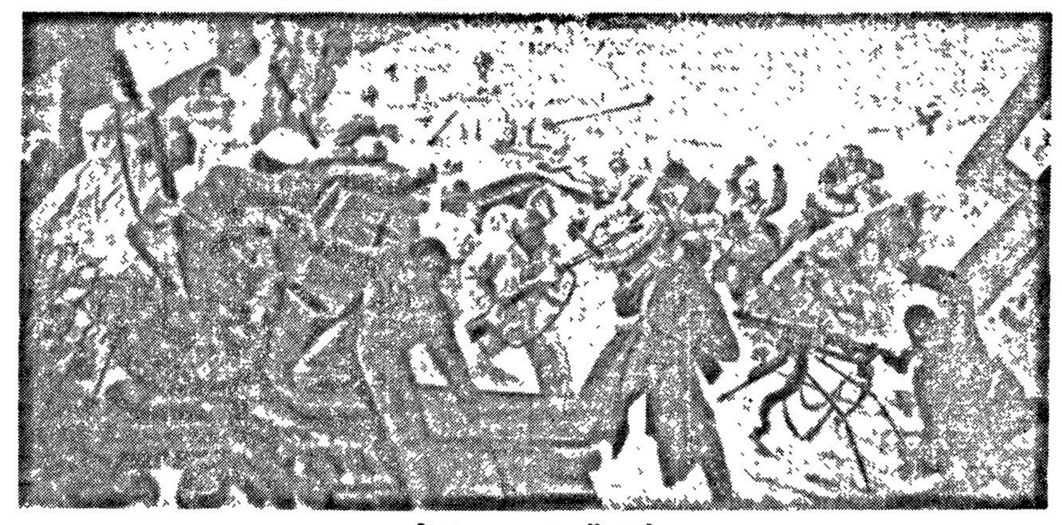
«Разгром немцев под Москвой». Память П. СОКОЛОВА-ОКАЛИ, В. ЯКОВЛЕВА, П. МАЛЬКОВА и П. ШУХМИНА для выставки «Великая отечественная война».

Непоколебим наш народ. Навсегда останется священной для человечества слово Сталинград и имя бессмертного защитника его — советского воина. Никогда Россия не будет принадлежать чужеземцу, никогда народ наш не станет рабом. Далекий кажется тот день, — двадцать пять лет назад — когда, выйдя из своих квартир, мы услышали: «Большевики победили!»