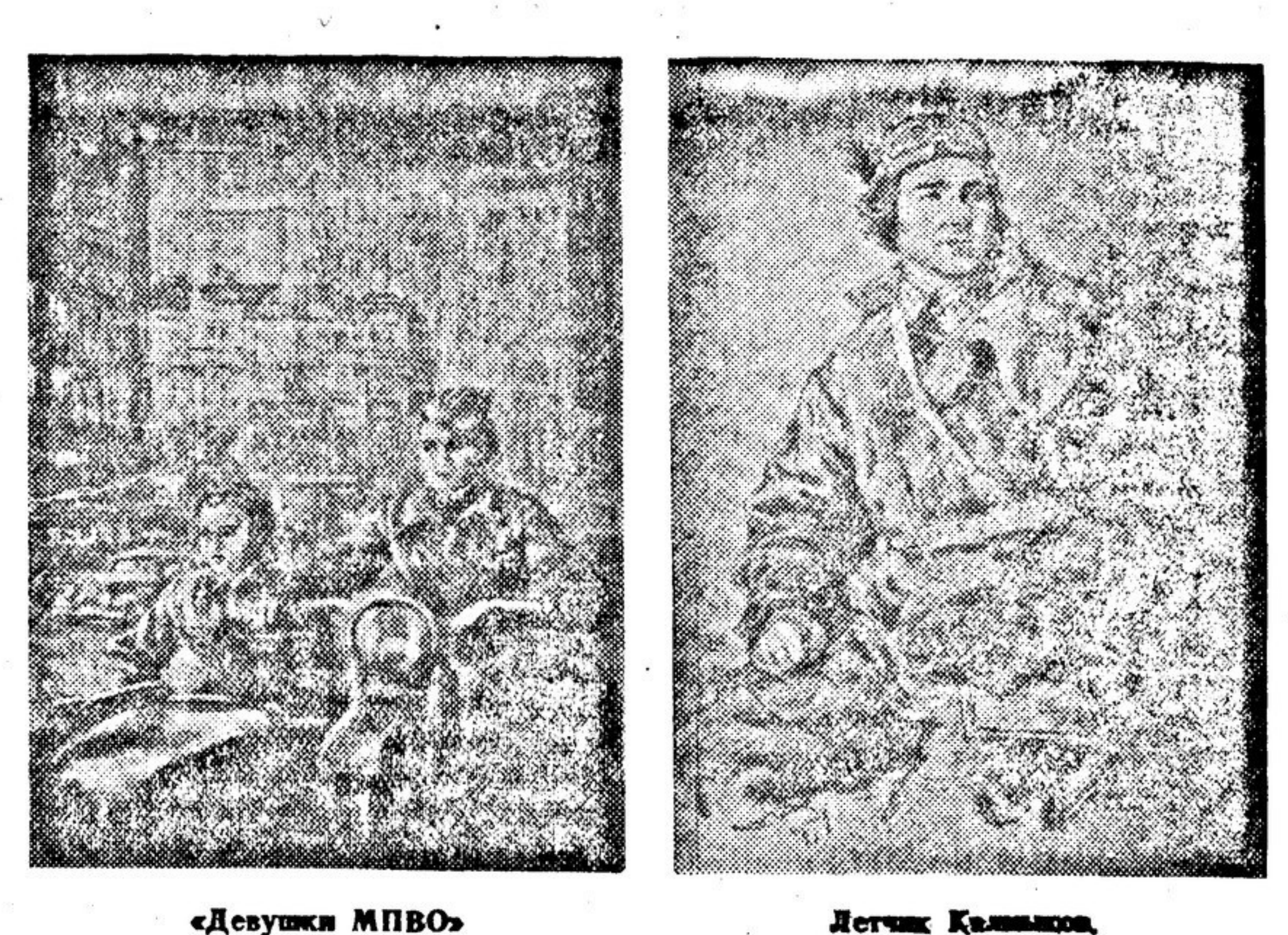
«Девушки МПВО» Картина В. ПАТЛОВА. Выставка «Великая отечественная война».